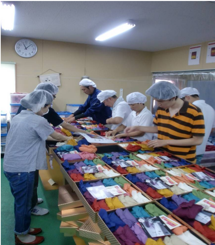
内職工場での箱詰め